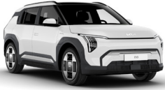
Clear White (UD) alapfényezés