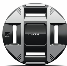
19" keréktárcsa (XM)