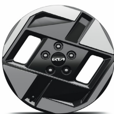
17" keréktárcsa (VA)