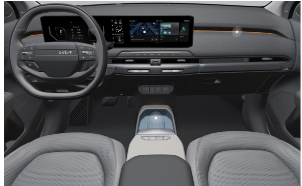
EARTH PLUS - sztenderd szürke 2tone vegán bőr üléskárpit - ELG (Blue díszbetéttel)