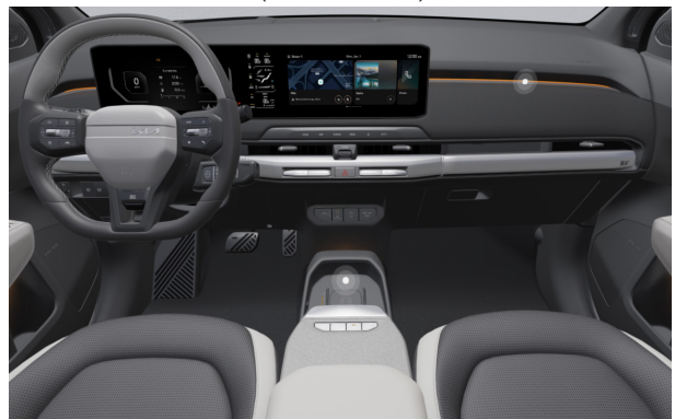
GT-LINE - sztenderd törtfehér-szürke vegán bőr üléskárpit - DFS