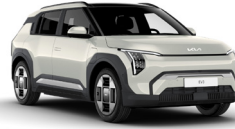
Ivory Silver (ISG)