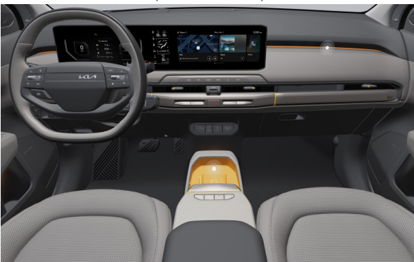
EARTH PLUS - opciós világos szürke 2tone vegán bőr üléskárpit - (Orange díszbetéttel) EWR