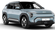
Frost Blue (EBB)