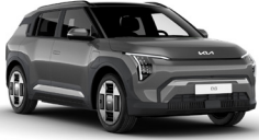
Shale Grey (EBD)